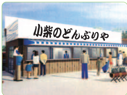
▲お店のイメージイラスト