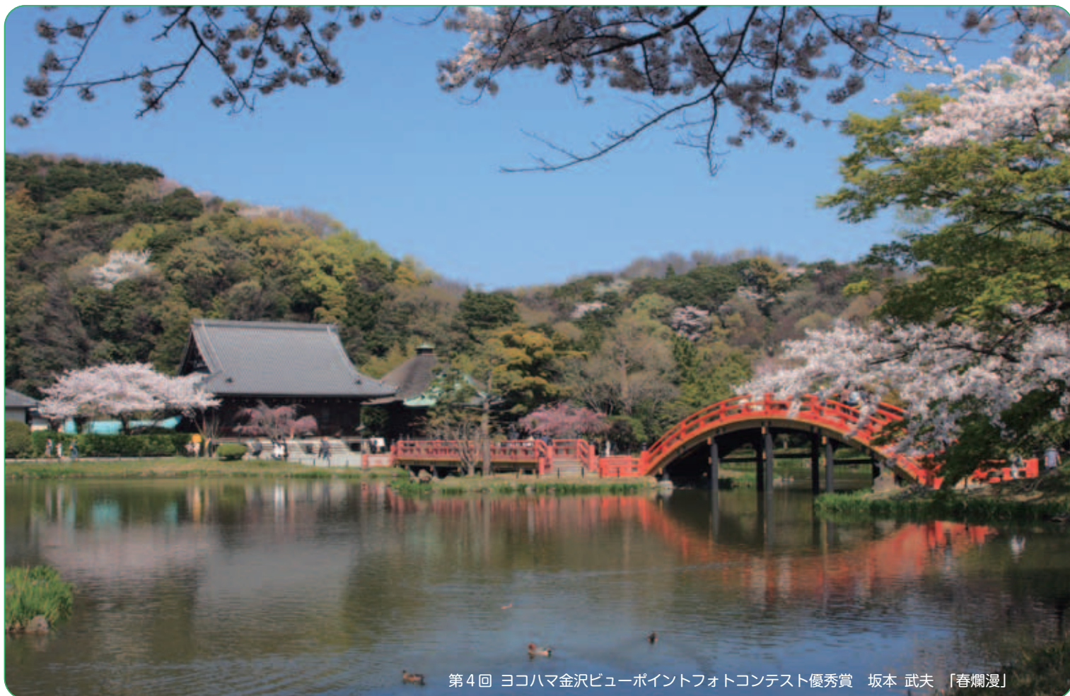
第4回 ヨコハマ金沢ビューポイントフォトコンテスト優秀賞 坂本 武夫 「春爛漫」