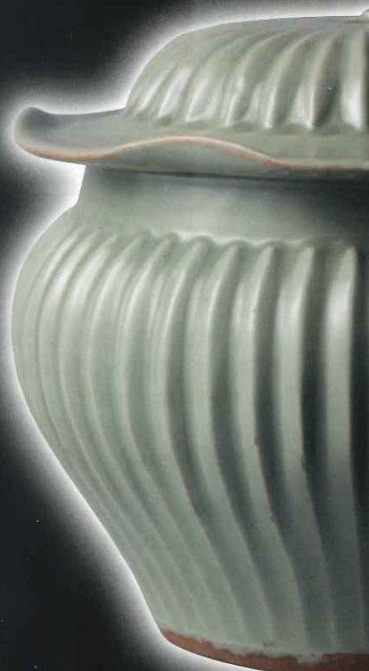
重要文化財 青磁壺

ご来館の際は、新型コロナウイルス感染症まん延防止へのご協力をお願いいたします。発熱等、体調のすぐれない方はご来館をお控えください。状況に応じて、会期や関連行事等を変更あるいは中止する場合があります。最新の情報は、当館ホームページ、Twitterをご確認ください。また、お電話でのお問い合わせも承ります。