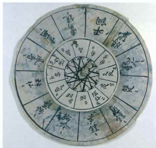
国宝 十二調子九調