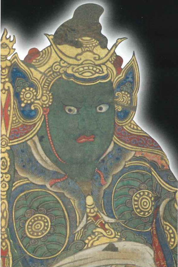
重要文化財 十二神将像のうち寅神(展示期間3/26~4/24)