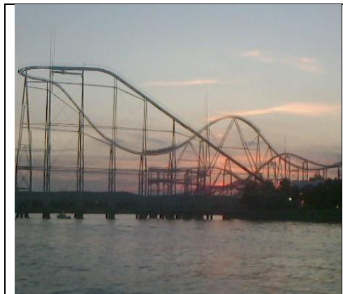
金沢沖からの夜景(1)