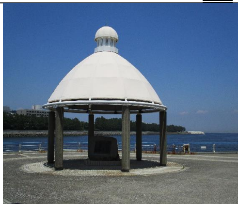
アメリカン・アンカレッジ記念碑