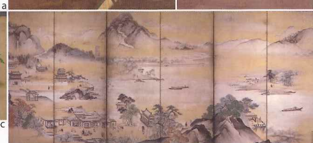
a. 重要文化財 二河白道図 鎌倉時代 香雪美術館【前期】 b. 国宝 六道絵(人道不浄相) 鎌倉時代 聖衆来迎寺【前期】 c. 神奈川県指定文化財 一遍上人縁起絵 巻二(塩竈) 南北朝時代 清浄光寺【後期】 d. 国宝 病草紙(齒槽膿漏の男) 平安時代 京都国立博物館【後期】 e. 重要文化財 青磁壺 元時代 称名寺 f. 狩野山楽落款 西湖図屏風(左隻) 江戸時代 サントリー美術館【前期】 g. 重要文化財 紺紙金字法華経 巻二(部分) 平安時代 本興寺【後期】