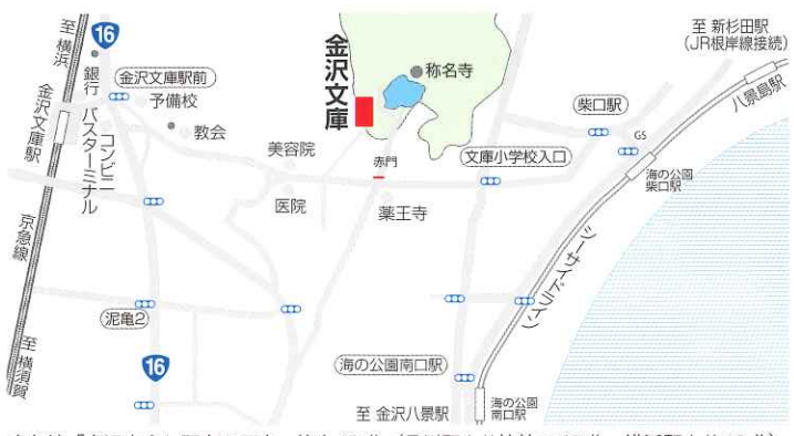
京急線「金沢文庫」駅東口下車、徒歩12分(品川駅より快特で33分、横浜駅より16分) シーサイドライン「海の公園南口」駅下車、徒歩10分(JR根岸線「新杉田」駅接続)