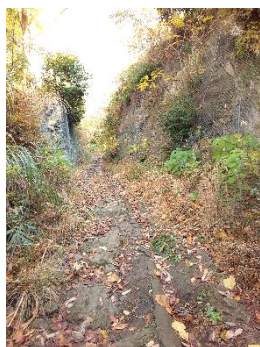
六国峠ハイキングコース