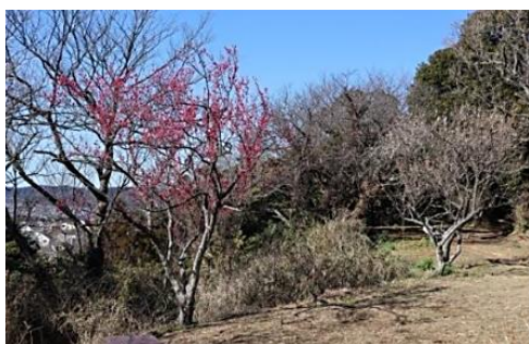
能見堂跡の紅白梅

* 無線ガイドシステムを使用いたします。ご自分のイヤホン（ \varnothing 3.5 mm）を必ず持参してください。