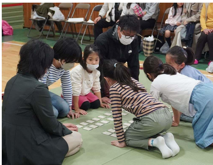
第3回大会での対戦風景