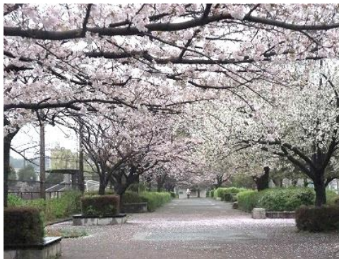
長浜公園の桜並木

* 無線ガイドシステムを使用します。ご自分のイヤホン（Ø 3.5 mm）を必ず持参してください。