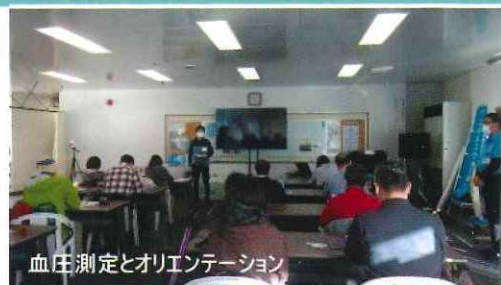
血圧測定とオリエンテーション