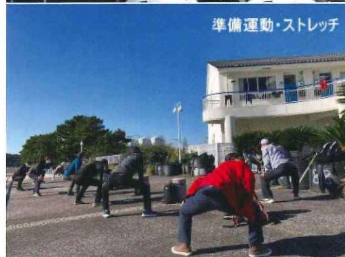
準備運動・ストレッチ