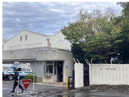
第一機動隊(旧飛行艇格納庫)