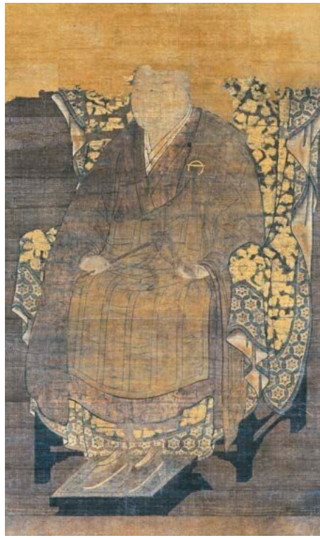
伝湛睿和尚像 南北朝時代 称名寺所蔵