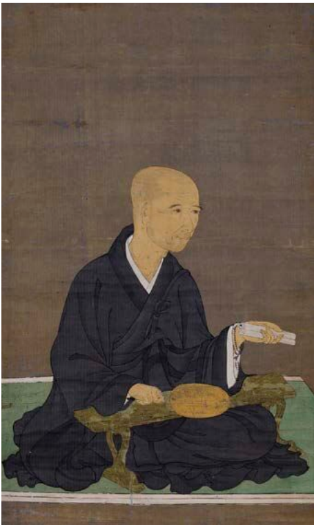
明恵上人像 南北朝時代 久米田寺所蔵