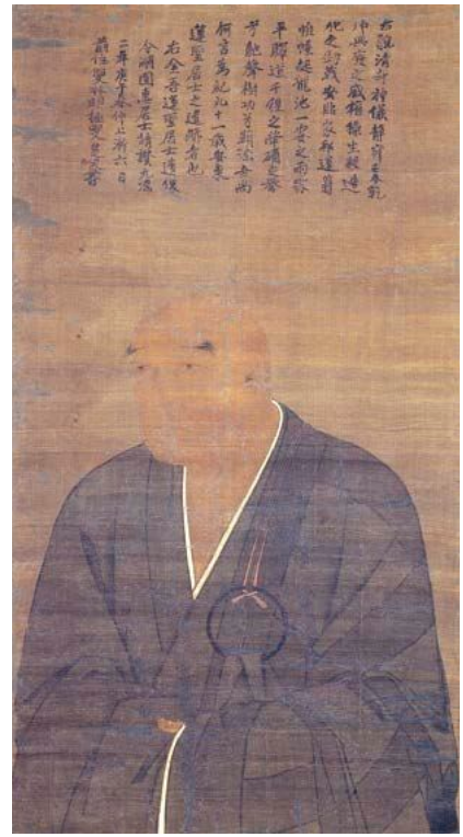
重文 安東蓮聖像 鎌倉時代 久米田寺所蔵