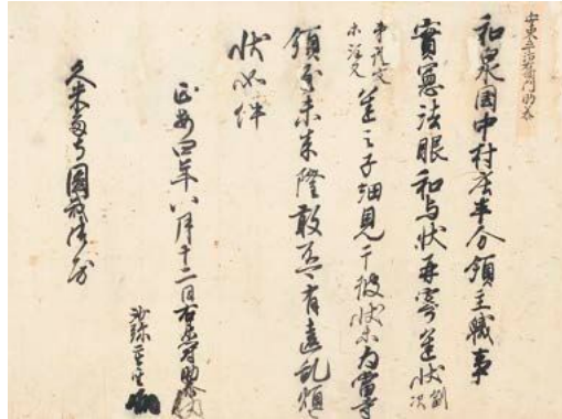
重文 安東蓮聖・助泰置文(「久米田寺文書」のうち) 鎌倉時代 久米田寺所蔵