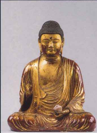
薬師如来坐像 寿福寺(神奈川) 重要文化財 北条政子発願で原型は運慶工房作とみられる