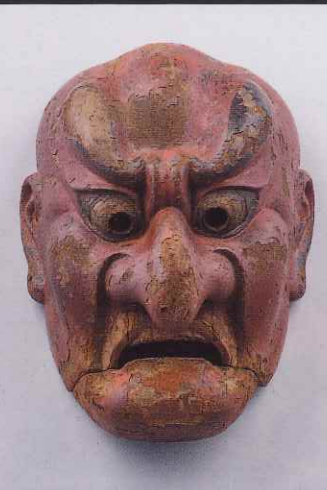
抜頭面 運慶作 瀬戸神社 重要文化財 建保七年(1219)運慶が夢想により製作