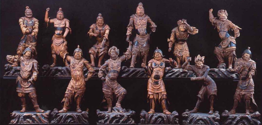
十二神将立像 曹源寺(神奈川) 重要文化財 運慶工房作の十二神将立像を一挙公開