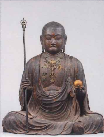
地藏菩薩坐像 康慶作 瑞林寺(静岡) 重要文化財 運慶の父が治承元年(1177)東国武士のために造像