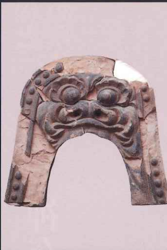
鬼瓦 鎌倉市教育委員会 鎌倉永福寺出土で原型は運慶工房作とみられる