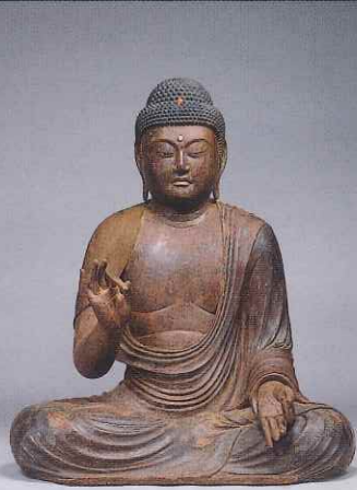
阿彌陀如来坐像 願生寺(静岡) 運慶作浄栄寺阿彌陀如来坐像に酷似する注目作