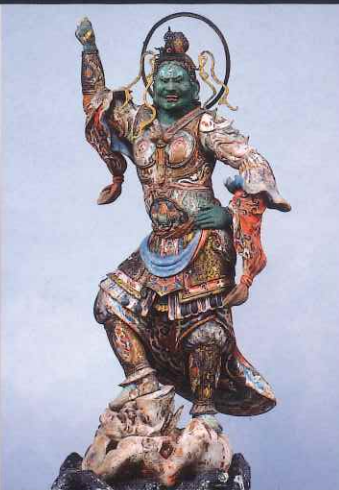
四天王立像(持国天) 海住山寺(京都) 重要文化財 解脱上人貞徳ゆかりの四天王像で運慶工房作とみられる