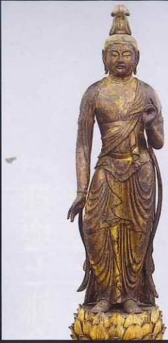
観音・勢至菩薩立像 清水寺(京都) 重要文化財 京都における鎌倉時代初期の運慶工房作とみられる