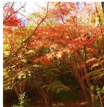
草舞台公園の紅葉