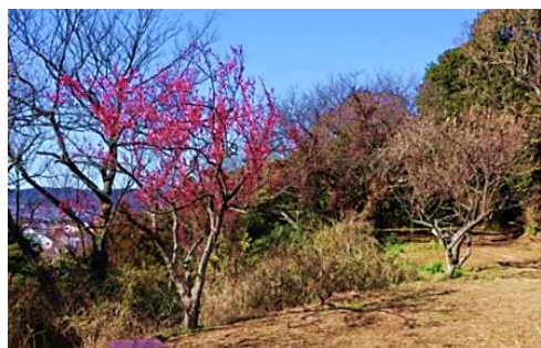
能見堂跡の紅白梅