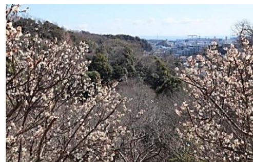
金沢自然公園梅林からの眺望