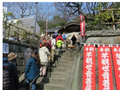
長昌寺芋観世音前の行列