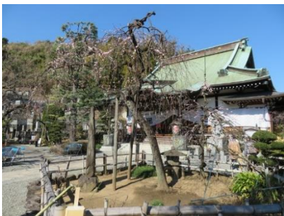
妙法寺の照水梅と本堂

* 無線ガイドシステムを使用します。ご自分のイヤホン（φ3.5mm）を必ず持参してください。