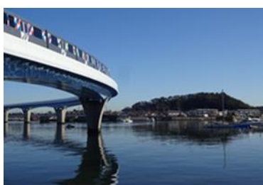
平潟湾プロムナードから