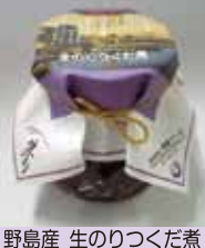
野島産 生のりつくだ煮