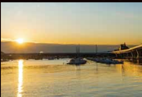
平潟湾日の出 木村篤史

2019年元日の日の出時刻は、6時50分。一年の始まりを感じながら、厳かな気持ちで初日の出を拜んでみてはいかがでしょうか？